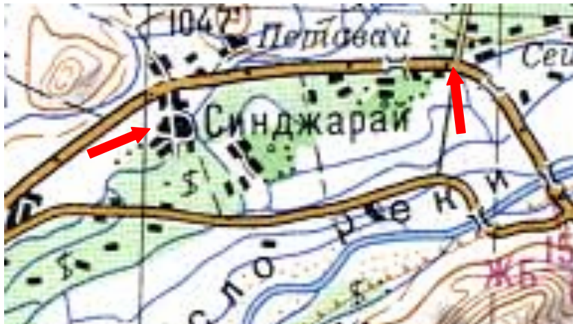
Mapa das FA soviéticas, ano de 1985. Cada quadricula no mapa tem 4km de lado