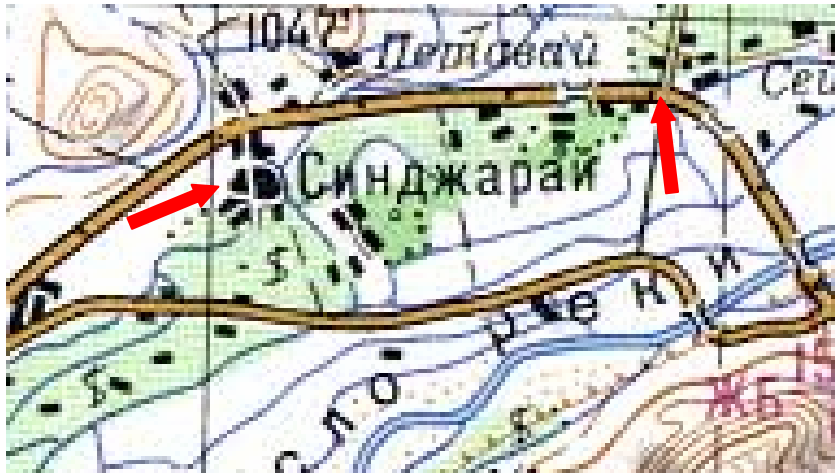
Mapa das FA soviéticas, ano de 1985. Cada quadrícula no mapa tem 4km de lado